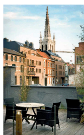
DE RODE LOPER